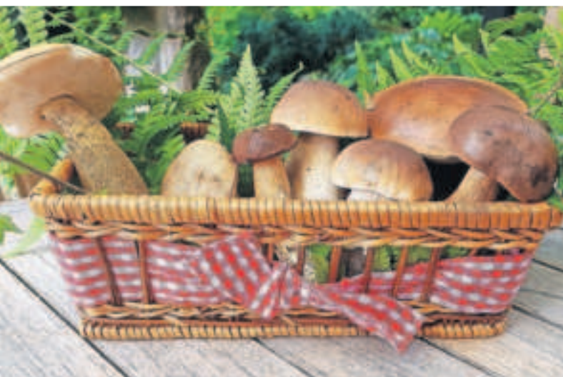
Bei einer Pilzlehrwanderung des Katholischen Forums am 28. Juni werden Pilze bestimmt.

Pilzsuche mit Bestimmung der wesentlichen Unterscheidungsmerkmale und Bestandteile der Pilze. Wichtig: Es erfolgt keine Verzehrfreigabe der Pilze. Kosten: 18,50 Euro. Mit Anmeldung. FBS, Katholisches Forum Krefeld-Viersen, Rektoratstraße 25, Viersen , Telefon 02162 50199-0, www.forum-krefeld-viersen.de