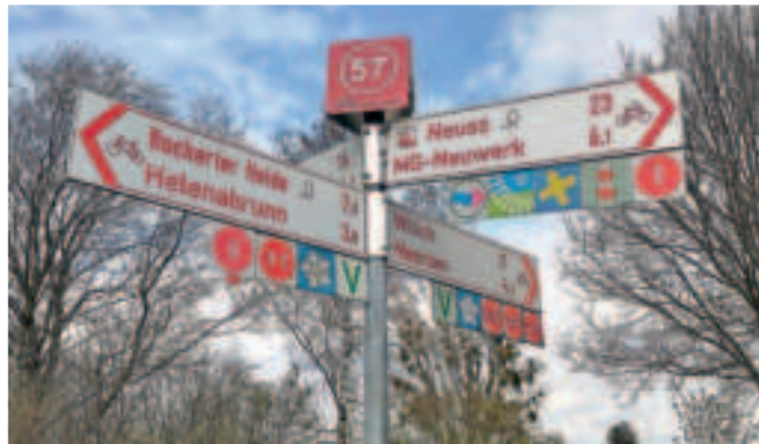
Anregungen zu Fuß- und Radverkehr erwünscht.

Viersen , Stadthaus, Rathausmarkt 1: Dienstag, 11. Juni,