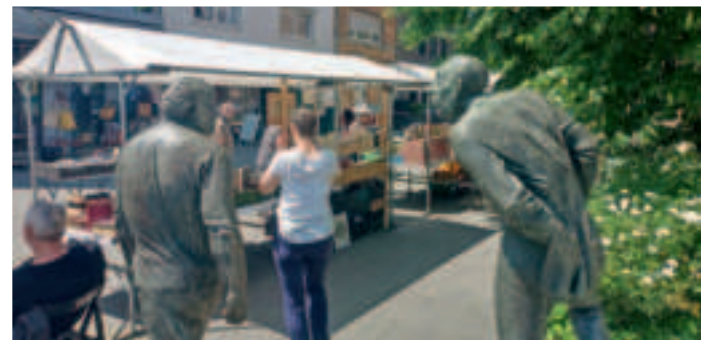
Der Büchermarkt ist ein fester Bestandteil in Süchteln.

Am Samstag, 15. Juni, beginnt das Markttreiben um 11 Uhr, ebenso wie am Sonntag, 16. Juni. An diesem dritten Tag kombiniert Süchteln seinen französischen Markt und alle Aktivitäten darüber hinaus mit dem verkaufsoffenen Sonntag. Die Geschäfte sind zwischen 13 und 18 Uhr geöffnet. Um 20 Uhr endet das Stadtfest. Das Citymanagement und die vielen Engagierten stemmen die Organisation. Hauptsponsor des Stadtfestes sind die Volksbank Viersen und die Landbäckerei Stinges & Söhne.