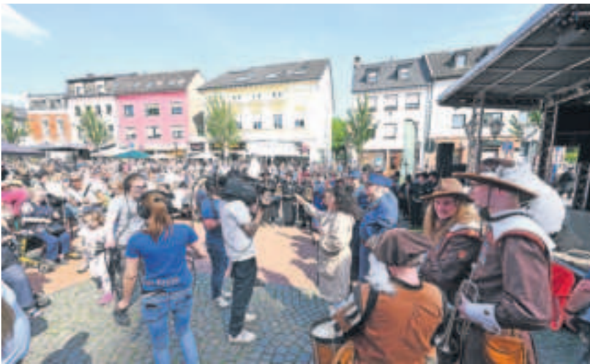
Hingucker-Motive und gefragte Gesprächspartner: Die Berichterstattung zum Nachtwächter-Treffen erfolgte in Print, Bild, Video und Ton.