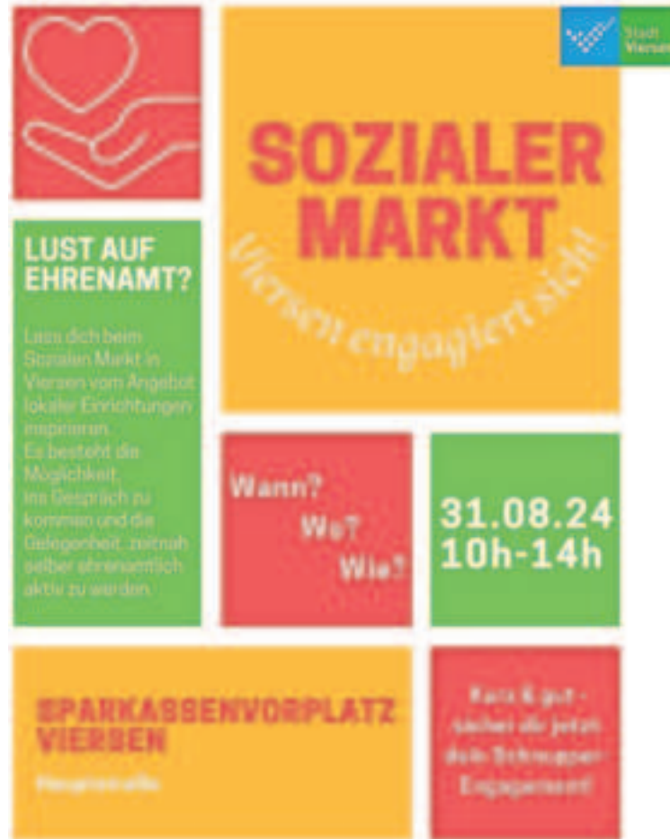
Das Plakat wirbt für den Sozialen Markt.

Der Soziale Markt will sich als Kontaktplattform festigen, Angebot und Nachfrage verknüpfen. Wer also ein konkretes Engagement-Angebot für seine soziale Einrichtung plant oder im laufenden Jahr noch planen möchte und in diesem Zusammenhang ehrenamtliche Unterstützung sucht, hat folgende Möglichkeiten: Am Markttag, 31. August, können sich Einrich-