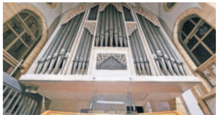
Über die Orgel in St. Cornelius lässt sich viel erzählen.

Katholische Kirchengemeinde St. Cornelius und Peter, www.st-cornelius-und-peter.de