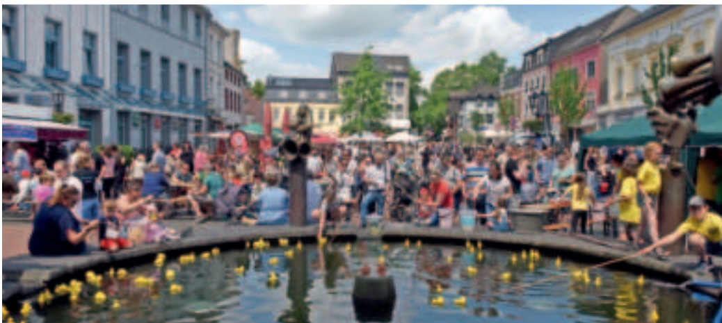
Entenangeln auf dem Markt: Das ist ein sehr beliebtes Angebot beim Kindertag in Dülken.

Die große Zahl an Spielstationen sorgt dafür, dass sich der Kindertag 2024 über die Grenzen der Altstadt hinaus erstreckt, Peterboroughplatz sowie Melcherstiege mit einschließt. Unter www.duelken.de/karte findet sich eine interaktive Karte mit allen Spiel-, Kreativ- und Action-Angeboten. Ermöglicht wird das Programm des Kindertages durch zahlreiche Sponsoren, deren Namensliste hier einzusehen ist: duelken.de/unsere-sponsoren . Alle Informationen zum Dülkener Kindertag bietet die Seite duelken.de hinter dem QR-Code.