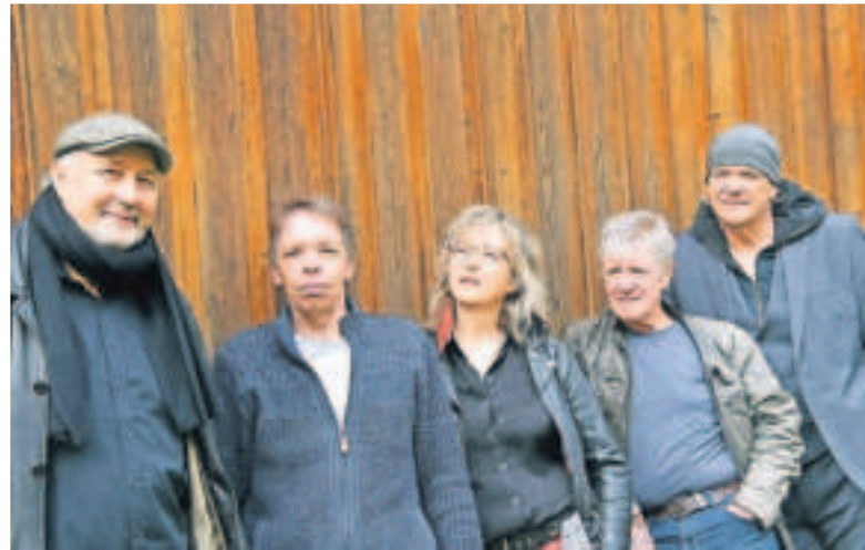
Blues & Rock in der Kaufbar Viersen gibt es am 28. Juni mit der Band „Belsonics“ aus Krefeld.

Im Mittelpunkt stehen der Gesang von Psalmen, eine Schriftlesung, sowie Gebete. Das Bach-Ensemble sowie das Vokalquintett „Just for Fun“ singen die liturgischen Teile der Vesper, deutsche Gregorianik und mehrstimmige Vokalmusik des 16.