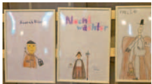
Zahlreiche Kinder hatten „ihre“ Nachtwächter gemalt. Die Motive wurden in der Pfarrkirche St. Cornelius ausgestellt.