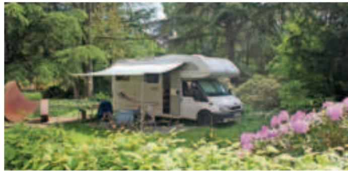
„Stadtbesetzung“ mitten im Skulpturenpark.