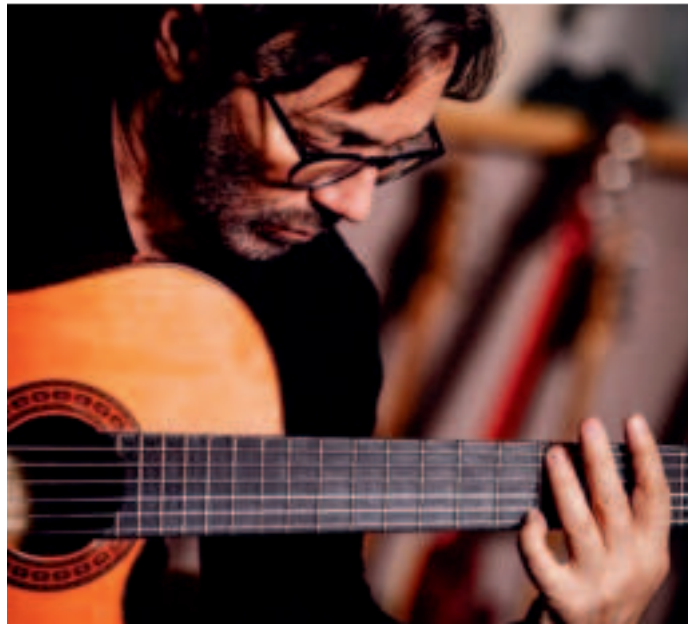
Beim Jazzfestival in Viersen ist der weltbekannte Jazz-Gitarrist Al Di Meola zu Gast.

Di Meola genießt bei Fans und in der Fachwelt Legendenstatus. In seiner seit vier Jahrzehnten andauernden Karriere arbeitete er mit Künstlern wie Luciano Pavarotti, Phil Collins, Herbie Hancock und Carlos Santana zusammen. Gemeinsam mit John McLaughlin und Paco de Lucia nahm er 1980 das Genre-prägende Akustikgitarren-Album „Friday Night in San Francisco“ auf. Beim Viersener Festival wird er gemeinsam mit seiner Band sein aktuelles Tourprogramm „The Electric Years“ vorstellen. Als roter Faden zieht sich dieses Mal das Saxophon als