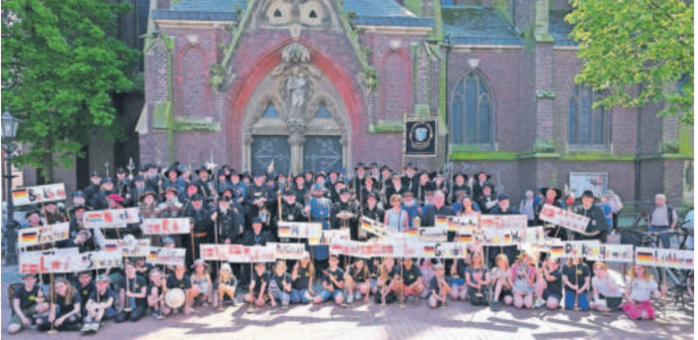
Gruppenbild vor der Pfarrkirche St. Cornelius mit allen Mitgliedern der Nachtwächter- und Türmerzunft und den Kindern, die die Ortsschilder getragen haben.