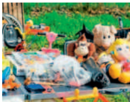
Schauen, Schnäppchen machen.

Die angebotenen Waren sollen kind- und jugendgerecht sein und Gewerbe-