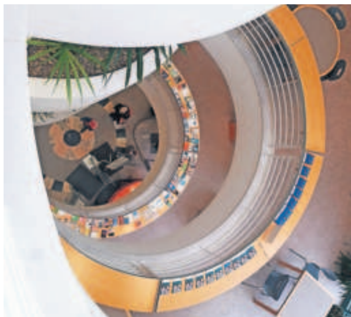
Die Albert-Vigoleis-Thelen-Stadtbibliothek in Viersen bietet im Juni auch wieder jede Menge Programm.

Telefon 02162 954890, info@amg-viersen.de, www.amg-viersen.de