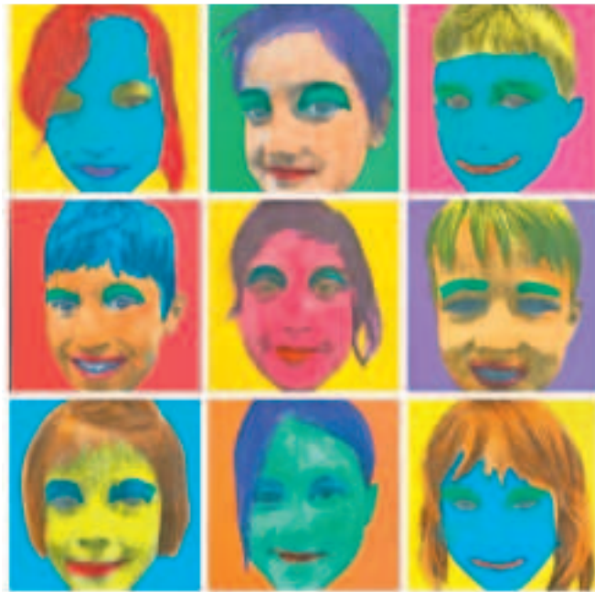
Das Werk vereint Kinder der Klasse 1b der Martinschule.

Die Gemeinschaftsschau umfasst das künstlerische Schaffen vom Kindergartenkind bis zu den Oberstufen. Diesmal sind dabei: die Kin-