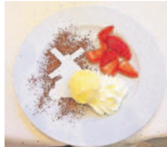
Die Dülkener Narrenmühle zierte den Dessert-Gang für die zünftigen Gäste.