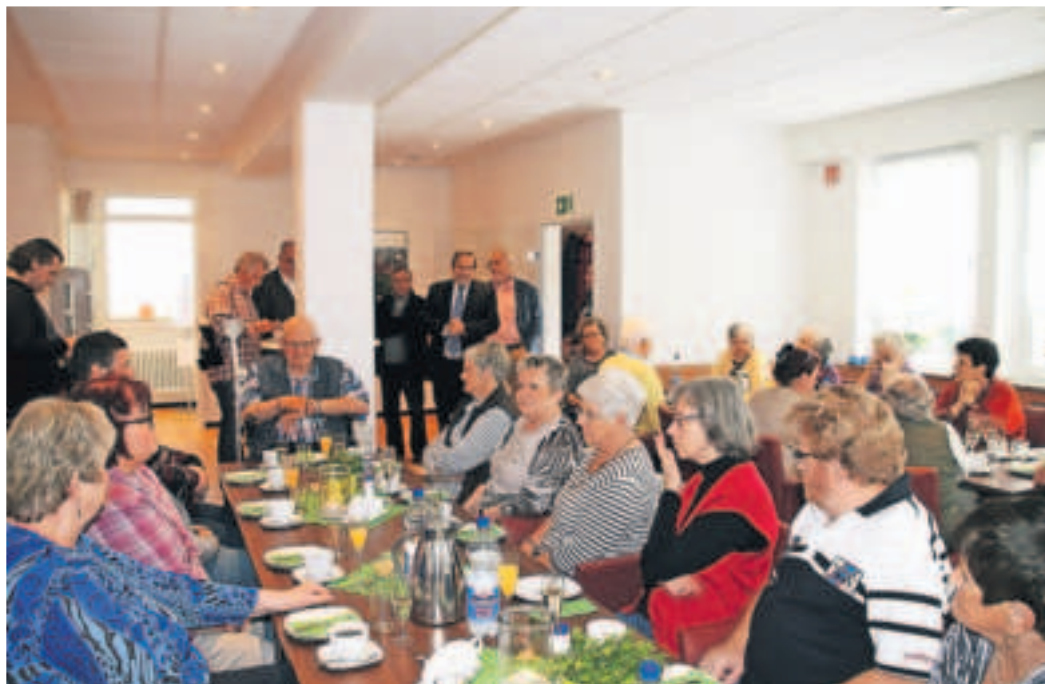
Das DüNo (Bewohnertreffpunkt Dülken Nord) am Straelener Weg ist beliebt und bietet ein vielfältiges Programm.