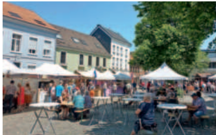
Französisches Flair in der Süchtelner Innenstadt im Juni.

Der Französische Markt auf dem Lindenplatz und den angrenzenden Straßen ist bei trockenem Wetter ein Garant für Besucherströme. Auch in der Region hat sich dieses Fest einen Namen gemacht. Im beschaulichen Süchteln bringt französische Kulinarik die Menschen zusammen. Heimatshopper bekommen am verkaufsoffenen Sonntag zusätzliche Stunden zum Schlendern, Stöbern und Einkaufen. Das Fest-Programm wird