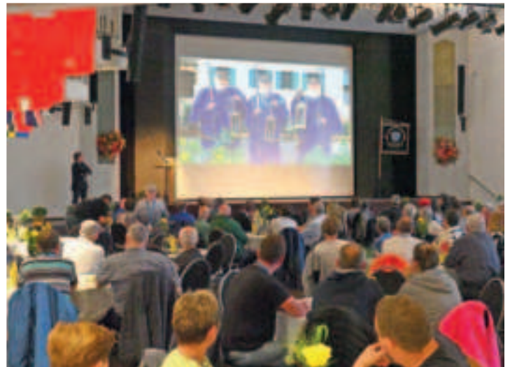
Im Dülkener Bürgerhaus fanden Begrüßung und der Empfang der Bürgermeisterin für die Zunft statt.

www.viersen.de , www.nachtwaechter-duelken.de , www1.wdr.de/fernsehen/aktuelle-stunde/alle-videos/aktuelle-stunde-clip-aktuelle-stunde-11-05-2024-100.html