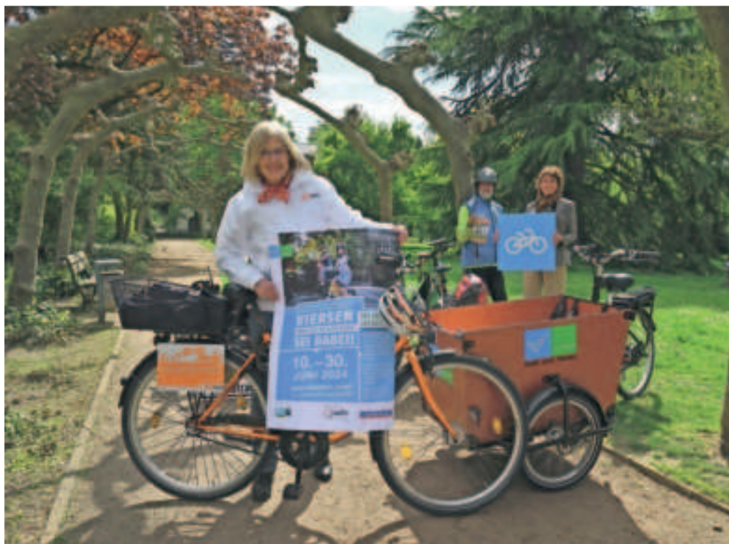
In den Sattel, fertig, los und stadtradeln für Viersen vom 10. bis zum 30. Juni.