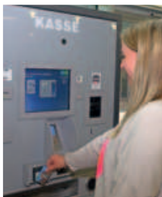
Der neue Kassenautomat im Service-Center ermöglicht die Zahlung mit Bargeld und den gängigen Karten.

Mit Hilfe des Kassenautomaten können alle anfallenden Bezahlvorgänge schnell und sicher erledigt werden. Die Suche nach passendem Bargeld hat ein Ende. Warte- und Bearbeitungszeiten werden kürzer. Zugleich kann die