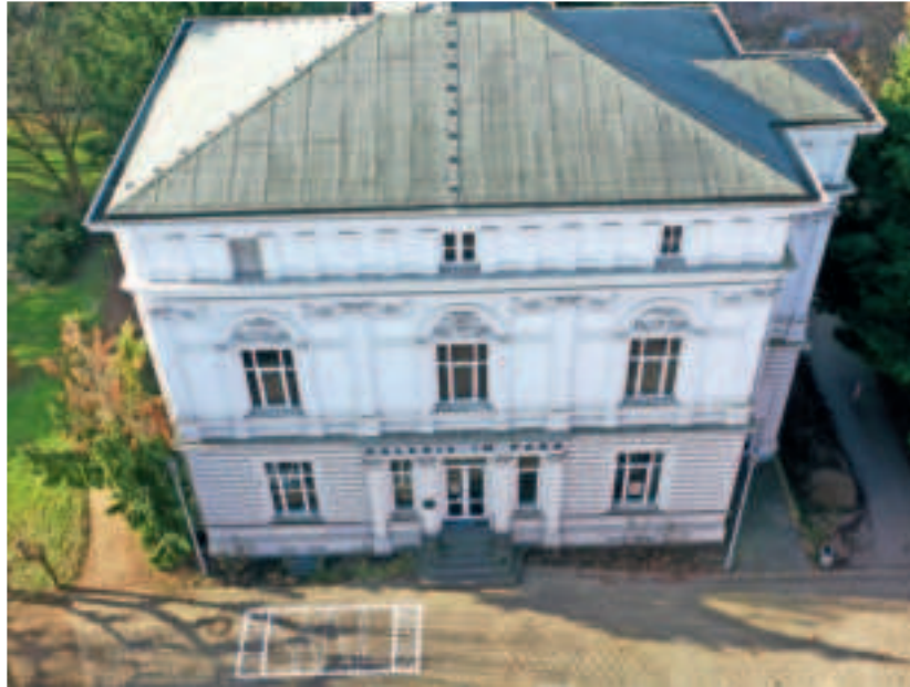
Die Kulturstrolche in Viersen blicken auch hinter die Kulissen der Städtischen Galerie im Park.