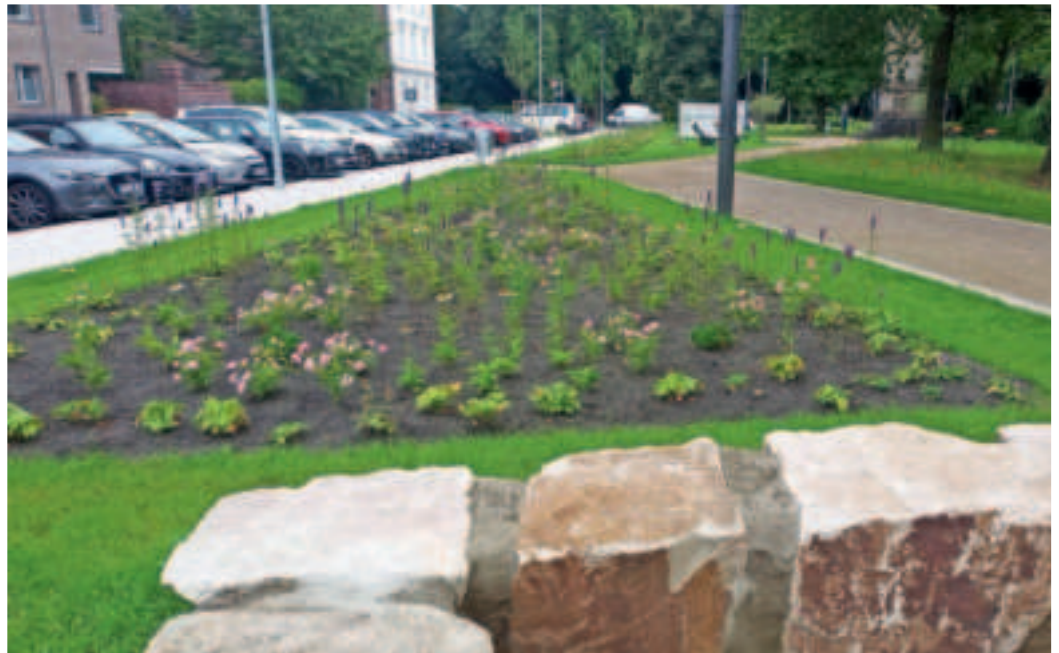
Die Gehölz- und Staudenflächen sind abwechslungsreich bepflanzt.

Fünf Wollapfel-Bäume werden von 27 Sträuchern – Felsenbirnen/Amelanchien – begleitet. 2500 bienenfreundliche Stauden sollen fliegenden Besuch anlocken. Ebenso platziert in die Staudenbeete werden 10.000 Rosen und Blumenzwiebeln, die für blü-