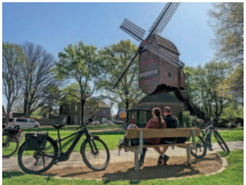
Am letzten August-Wochenende ist Mühlenfest in Dülken.