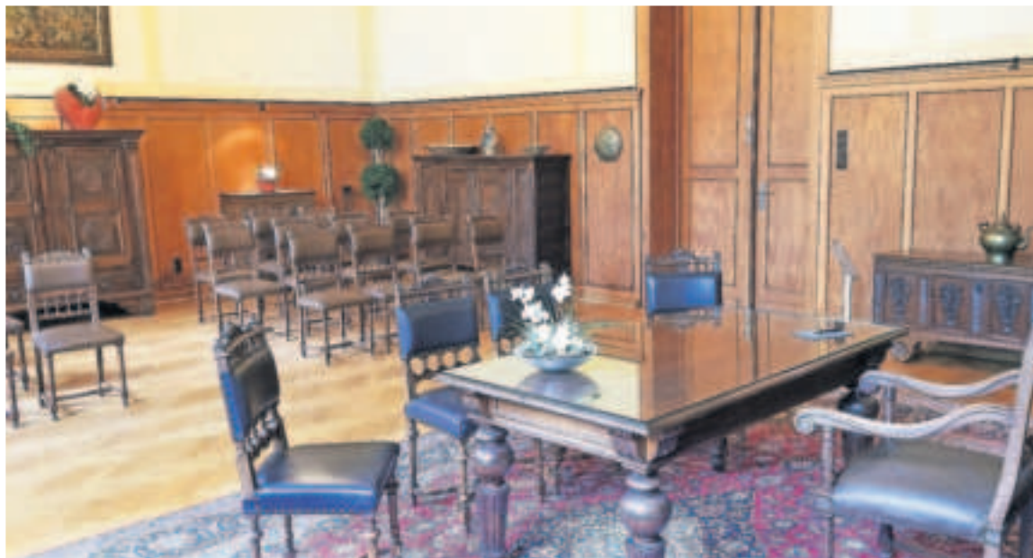
Ein Blick in das stilvolle Trauzimmer in Dülken. Die Zahl der Trau-Orte in Viersen soll erweitert werden.

Ab 2025 sollen mehr attraktive Trau-Orte im Stadtgebiet angeboten werden, außerdem weitere Termine, insbesondere freitags- und samstagsnachmittags. Aussichtsreiche Vorgespräche des Standesamtes mit der Eventlocation „Hammer Mühle“ in Viersen und mit dem „Kirschhof“ in Süchteln laufen bereits. Um mehr Trauungen an