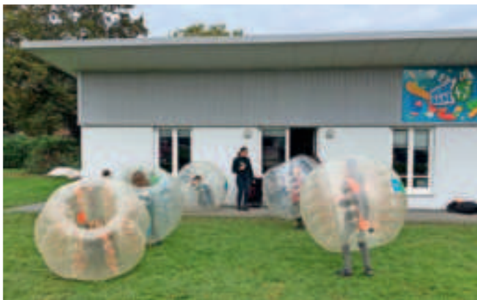
Das Jugendfreizeitzentrum Homebase 42 bringt solche Bubbleballs mit zum Hohen Busch.