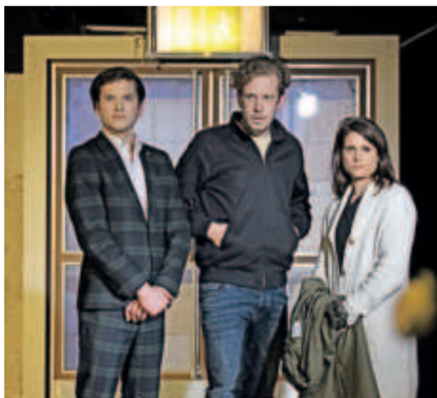
Das Staatstheater Mainz bringt im Februar 2025 in der Abo-Reihe Studio „Sophia, der Tod und ich“ auf die Bühne. Es ist ein Theaterstück nach dem Roman von Thees Uhlmann. Im Anschluss an die Vorstellung ist ein Publikumsgespräch geplant.