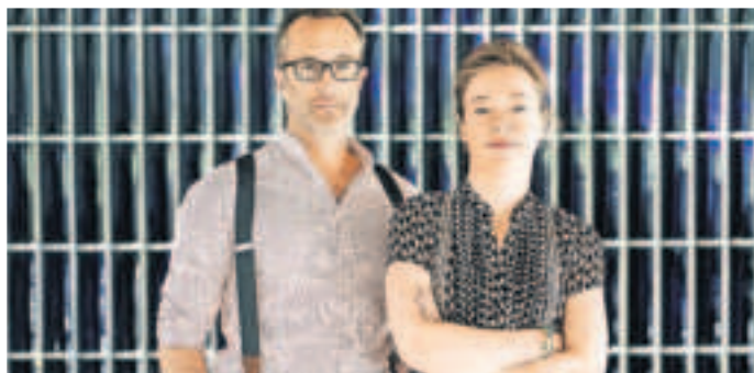
Das Duo „Wein, Weib & Cello“.

Im Monat August gibt es einen Kultur-im-K2-Termin an der Burgstraße 2 in Viersen. Das Duo „Wein, Weib & Cello“ gastiert an diesem Abend mit Musik und Literatur. Oder wie es im Untertitel heißt: „Solang‘ nicht die Hose am Kronleuchter hängt.“ Es geht um die Goldenen Zwanziger. Der Vierfalt.Spot geht für sie an.