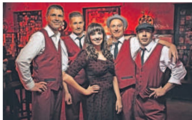
„Dülken goes Rock'n'Roll“ heißt es am 17. August: Open-Air werden sich „The Solid Studs“ präsentieren.

Kreismusikschule Viersen, Telefon: 02162 39-2321, musikschule@kreis-viersen.de, www.kreismusikschule-viersen.de