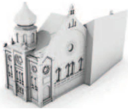
Das Schnittmodell der ehemaligen Synagoge in Dülken.

Es ist beabsichtigt möglichst alle Fußgänger- und Radfahrersignalgruppen zyklisch in allen Richtungen parallel zu den Signalgruppen des KFZ-Verkehr zu schalten. Ein absoluter Verzicht auf Anforderungen wird aus Leistungsfähigkeitsgründen gerade bei den stark belasteten Knotenpunkten nicht möglich sein. Die Umsetzung der oben genannten Punkte erfolgt allerdings im Rahmen einer Neuplanung; Bestandskontenpunkten können nicht flächendeckend umprogrammiert werden.