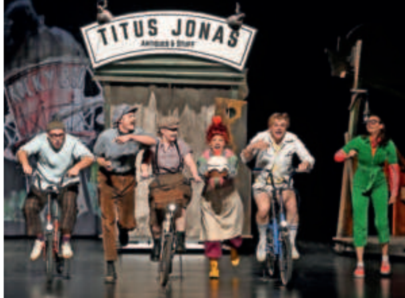
Die drei ???-Kids werden im November in Viersen erwartet. Sie und ihr Publikum bekommen es mit einem singenden Geist zu tun. Die Vorstellung unter dem Label „Vierfalt.Kids“ ist für Kinder und Jugendliche kostenlos.