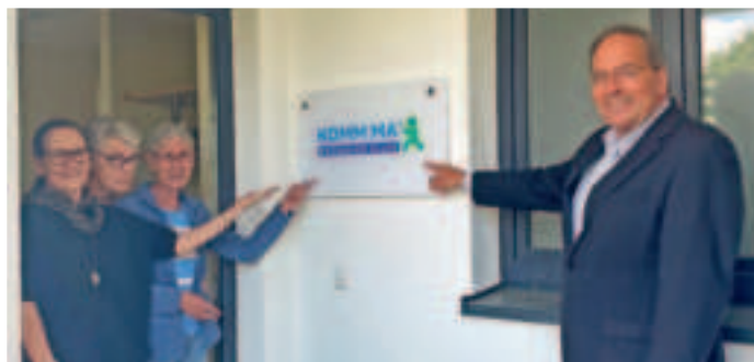
„Kommt mal rein. Neues Logo am Bewohnertreffpunkt Brüsseler Allee lädt dazu ein“.

Damit baut die VAB ein Erfolgsmodell aus, das inzwischen in vielen Wohnquartieren bei den Bewohnern für gute Nachbarschaft, Kontakt, Rat und Hilfe sorgt. Hier trifft man sich zu einem bunten Strauß von Gemeinschaftsaktivitäten, vom gemeinsamen Kaffeeklatsch über Spiele-