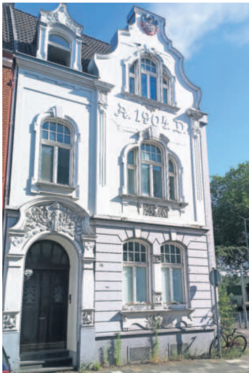
Das Wohnhaus Eichenstraße 16 in Viersen wurde 1904 erbaut und ist ein Paradebeispiel für gelungene Jugendstil-Architektur.

Das Giebfeld mit seinen pflanzlichen Ornamenten ruht auf geschwellten Wandpfeilern mit Sockeln. Der Eingang ist als nischenartiger Rundbogen gestaltet. Das