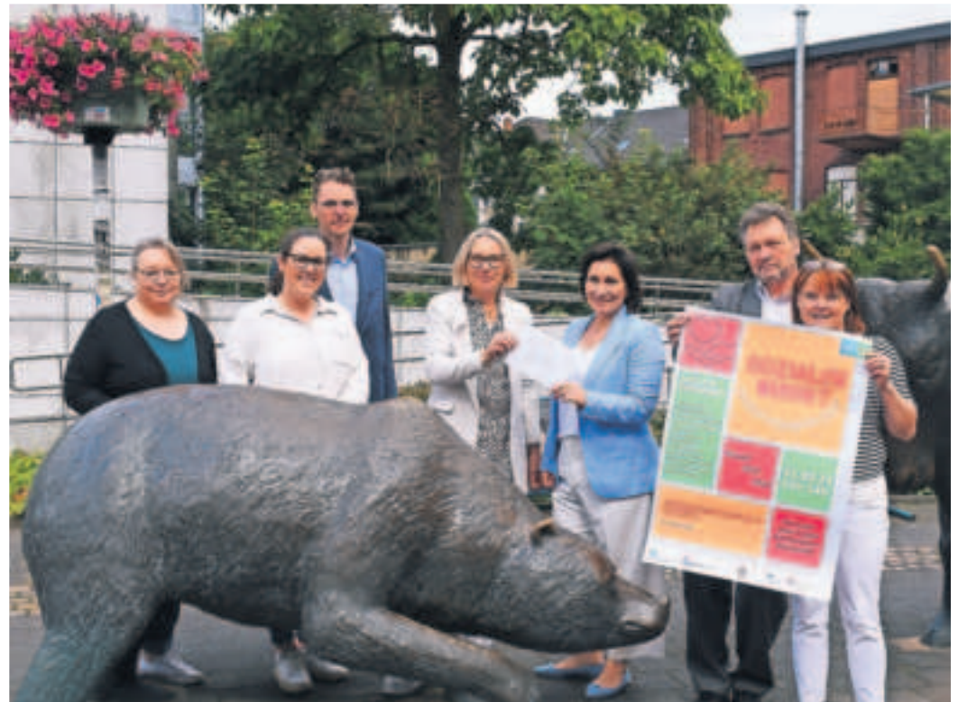
Starke Partnerschaft für den zweiten Sozialen Markt in Viersen: Die Sparkasse unterstützt das Organisationsteam des Marktes mit 500 Euro.

18 soziale Einrichtungen präsentieren sich