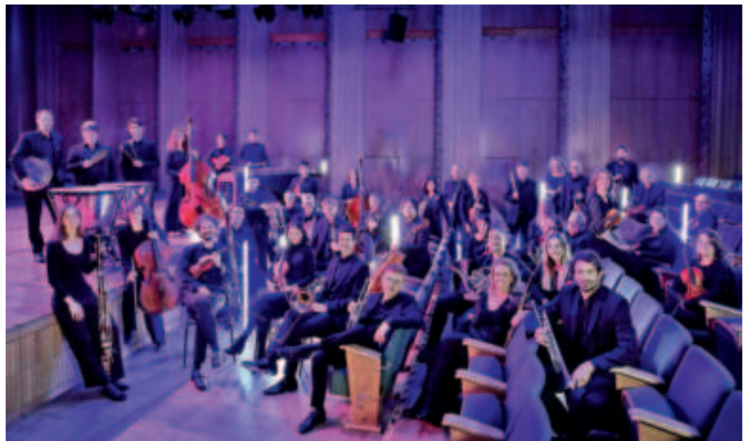
In der Abo-Reihe Sinfoniekonzert spielt das WDR-Funkhausorchester mit Wayne Marshall (Klavier und Leitung) am Donnerstag, 26. September 2024, 20 Uhr, Highlights aus George Gershwins großen Broadway-Erfolgen, Songs für Orchester und Rhapsody in Blue.

Alle weiteren Infos zu dieser Karte, zu den Abo- und Einzelveranstaltungspreisen und zum Kulturpass sind ebenfalls nachzulesen unter www.vierfalt-viersen.de