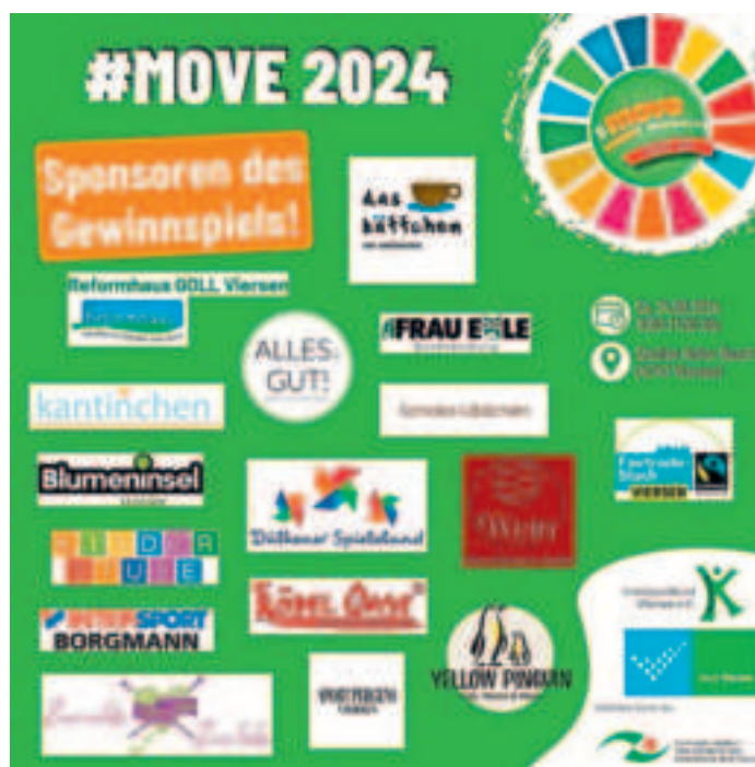
Das Plakat zum Sponsoren-Gewinnspiel.