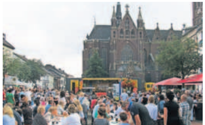
Die Mediterrane Nacht lädt am Samstag, 3. August, auf den Alten Markt nach Dülken ein.

Ristorante San Marco, unterstützt durch Volkmar Hess (Dülkener Haus des nostalgischen Klanges)