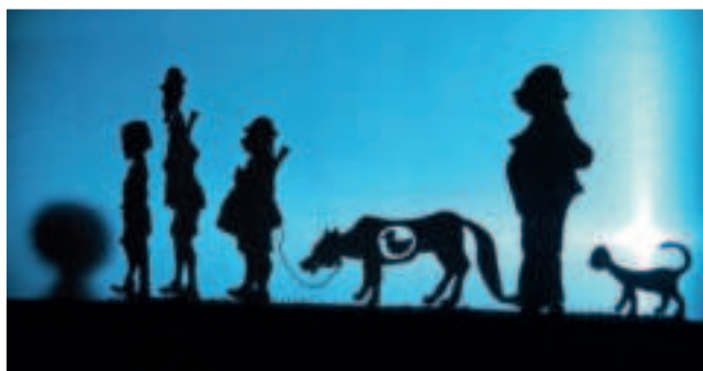
Der Klassiker „Peter und der Wolf“ wird als musikalisches Figurentheater Ende des Jahres drei Mal gezeigt. Das Theater con Cuore spielt am Sonntag, 15., und am Montag, 16. Dezember, im Weberhaus in Süchteln.