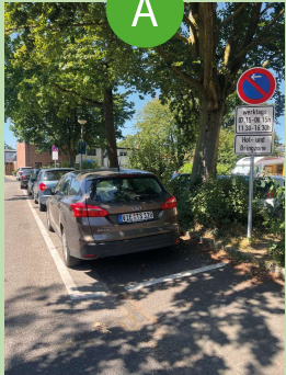
Straße Am Lützenberg ca. 280 m Fußweg zur Schule