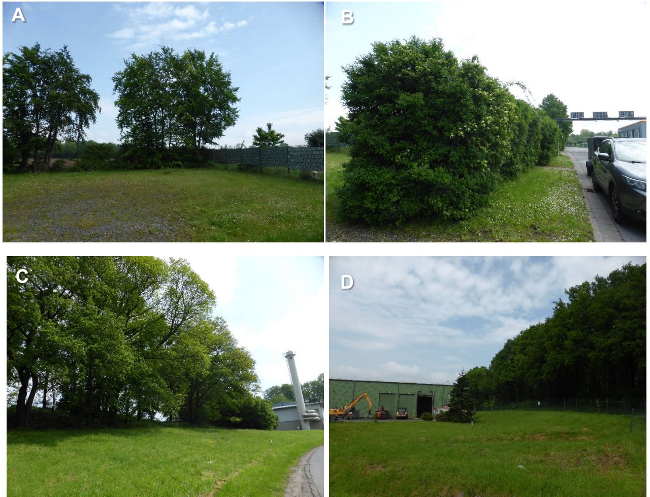
Abbildung 4: Randliche Eingrünung