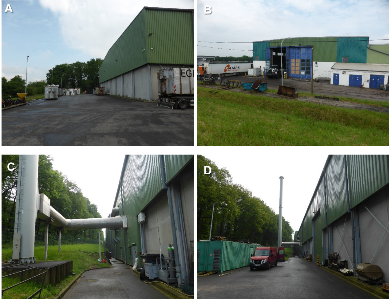
Abbildung 3: Umschlaghalle für die Abfallsortierung

Ausgehend von einem außerhalb liegenden Rückhaltebecken kreuzt ein Entwässerungsgraben das Gebiet, der zum Zeitpunkt der Begehung im Mai trocken war (vgl. Abbildung 5).