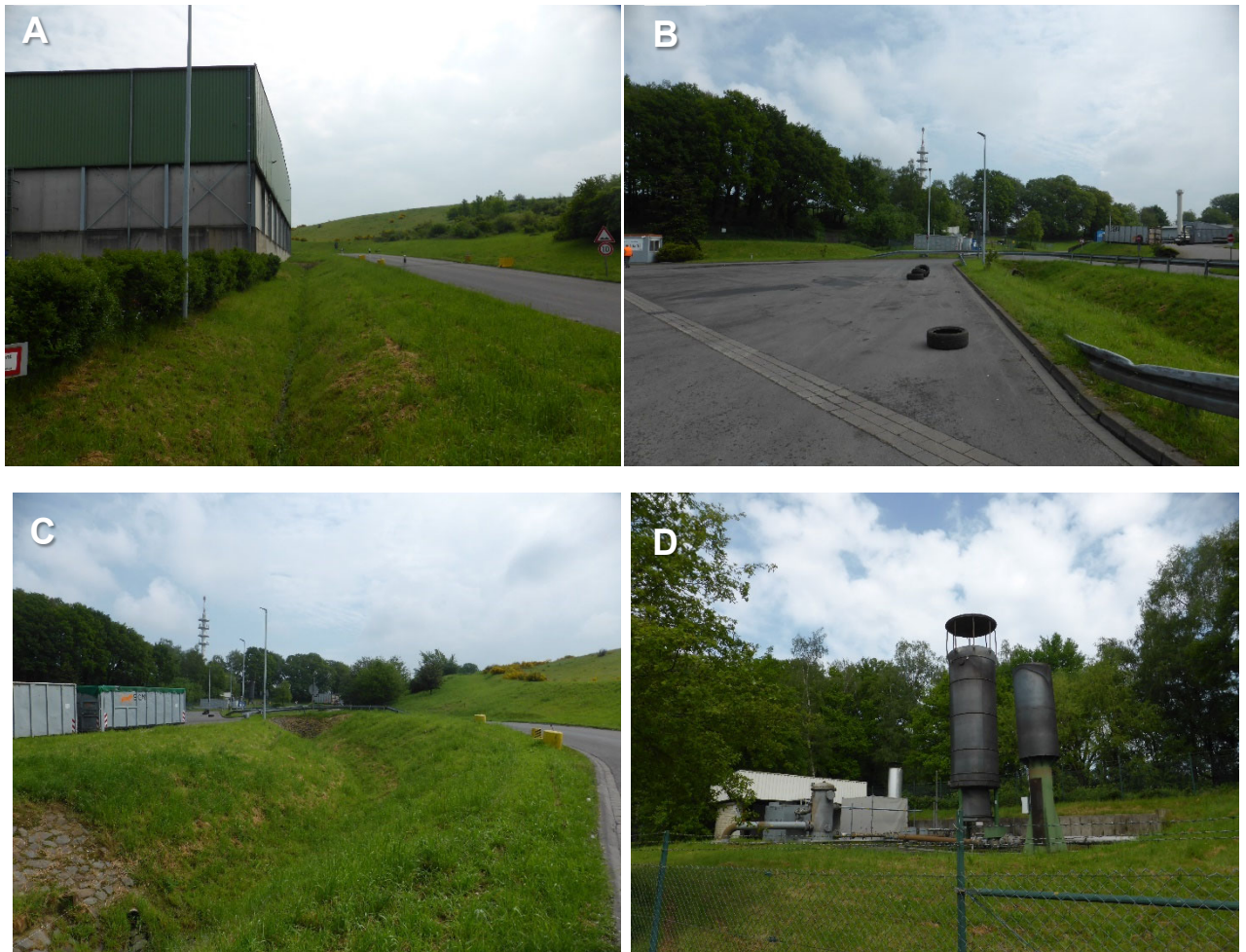
Abbildung 5: Entwässerungsgraben, Lagerflächen und Gasfackel A: Graben/Gewässer im Plangebiet B: Lagerflächen östlich der Umschlaghalle; Standort für Lagerüberdachung C: Erschließung mit Graben/Gewässer, im Hintergrund Laubgehölze (überw. mittelalte Eichen) an nördlichen Rand des Plangebietes D: Gasfackel Quelle: Eigene Aufnahmen, Mai 2024