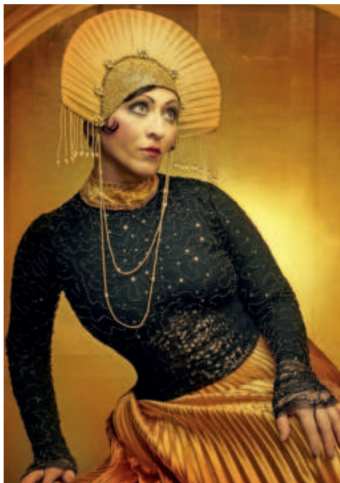
Die Show „Glanz auf dem Vulkan“ und das Berlin der 1920er-Jahre ist am Dienstag, 21. Januar, in der Festhalle zu erleben.

Die Show nimmt das Publikum mit in das Berlin der wilden 1920er-Jahre. Die Boheme der Welt feiert, als gäbe es kein Morgen: Opiumrausch, Absinth-Partys, Dadaismus, Anarchismus, zertanzte Schuhe, durchliebte Nächte. Mehr Informationen auf Seite 11. Festhalle Viersen, Hermann-Hülser-Platz 1, Viersen Kulturabteilung der Stadt Viersen, Heimbachstraße 12, Viersen, kartenvorverkauf@viersen.de, Telefon 02162 101-466 und -468, www.vierfalt-viersen.de