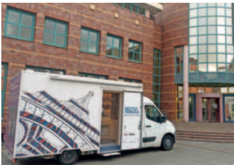
Der Medienbus des Institut Français parkt im Januar vor der Stadtbibliothek Viersen.

info@bwj-viersen.de , www.bwj-viersen.de