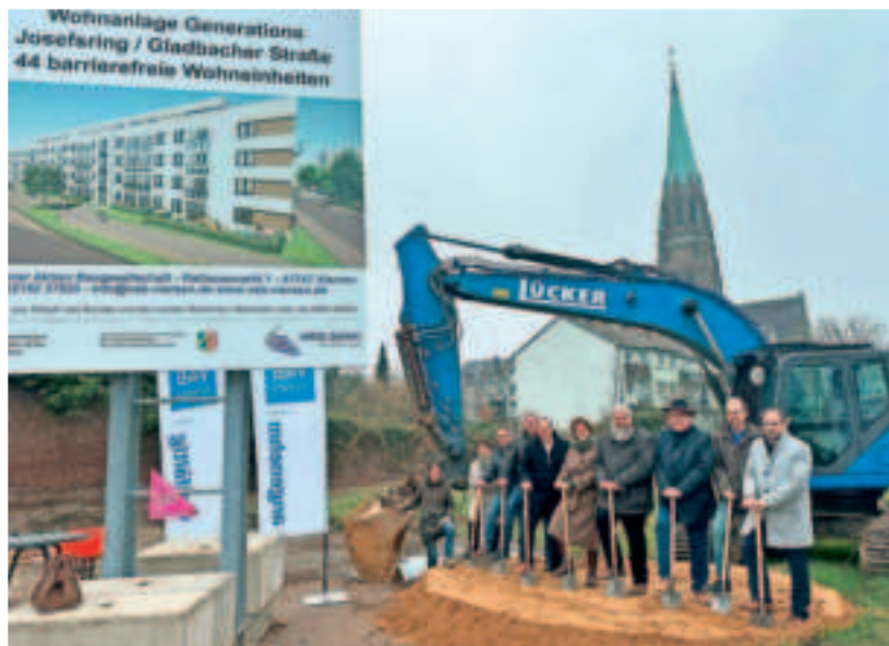
Der symbolische erste Spatenstich für die neue VAB-Wohnanlage Generations fand kürzlich mit allen Verantwortlichen statt.

„Wir haben viel zu wenig zeitgemäße Mietwohnungen für Familien und Einzelpersonen. Der Bedarf ist sehr groß. Die Menschen warten dringend darauf, aber er muss bezahlbar sein. Das ist die Quadratur des Kreises, der wir uns stellen. Unser Neubauprojekt