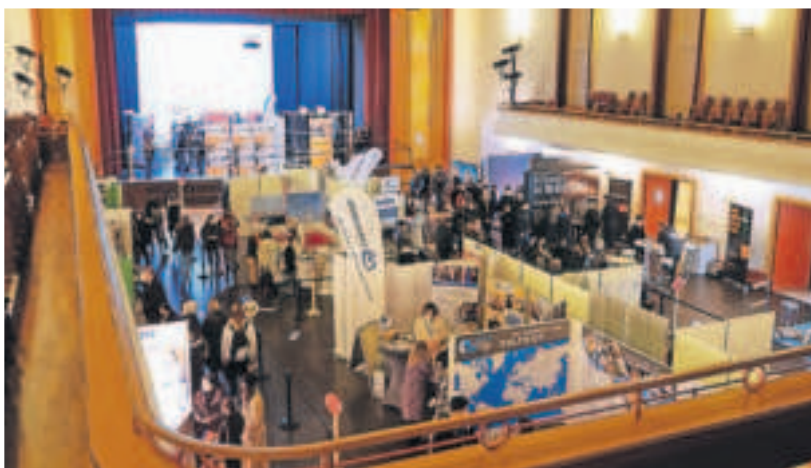
In der Festhalle werden Auszubildenden in spe viele Infos geboten.

Weiterführende Informationen und Einzelheiten zum Programm bringt die Februar-Ausgabe von Viersen aktuell, die am 26. Januar erscheint. Zahlreiche Infos und einen Rückblick auf die vergangene Messe bietet die Webseite www.azubimesse-viersen.de .