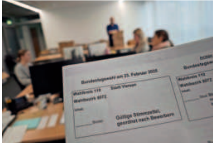
Die Wahldienststelle im Stadthaus ist besetzt.

Interessierte Wahlhelfende können sich direkt mit der Wahldienststelle der Stadt Viersen in Verbindung setzen.