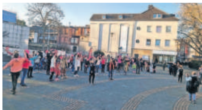
Am nächsten Valentinstag, 14. Februar 2025, wird in Viersen wieder ein Tanzflashmob veranstaltet.

Im Februar findet zum dritten Mal die Veranstaltung „One Billion Rising“ in Viersen statt. „One Billion Rising“ heißt aus dem Englischen übersetzt „Eine Milliarde erhebt sich“. Es handelt sich um eine internationale Kampagne, die sich für das Ende der Gewalt gegen Frauen und Mädchen und für Gleichstellung einsetzt. Die Stadt Viersen beteiligt sich.