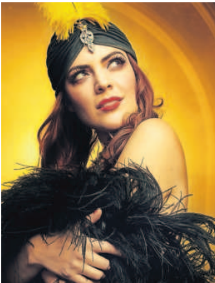
Die Show „Glanz auf dem Vulkan versetzt das Publikum in das Berlin der wilden 1920er-Jahre.

Telefonisch ist das Ticketing-Team der städtischen Kulturabteilung zu diesen Zeiten unter den Rufnummern 02162 101-466 und -468 erreichbar. Jederzeit ist eine Ticketanfrage unter kartenvorverkauf@viersen.de möglich.