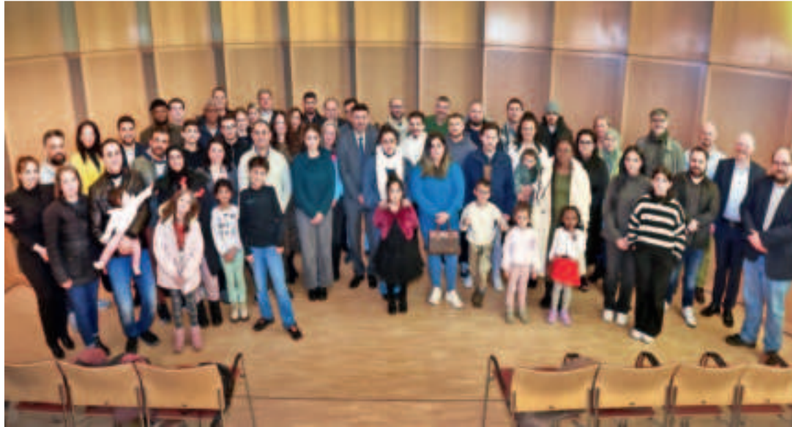
Die Premiere der Einbürgerungsfeier der Stadt Viersen war gut besucht. Mit dieser Feier würdigt die Stadt die Leistungen, die Entscheidungen und die Geschichte der eingebürgerten Menschen.

Im Ernst-Klusen-Saal der Festhalle Viersen fand im November die erste Einbürgerungsfeier der Stadt Viersen statt. 44 Menschen, die diesen Schritt gegangen sind, waren zu dieser Feierstunde gekommen. Insgesamt waren bis zu diesem Zeitpunkt in 2024 bereits 177 Personen eingebürgert worden.