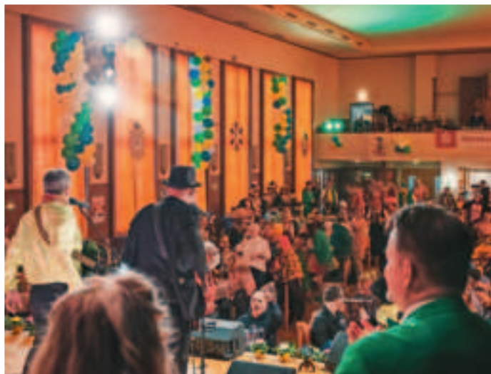
In den Sälen wird jeck Karneval gefeiert.

Die KG Hamm wer net feiert im Evangelischen Gemeindehaus, so am 17. Januar ihre Damensitzung, am 25. Januar die Galasitzung und