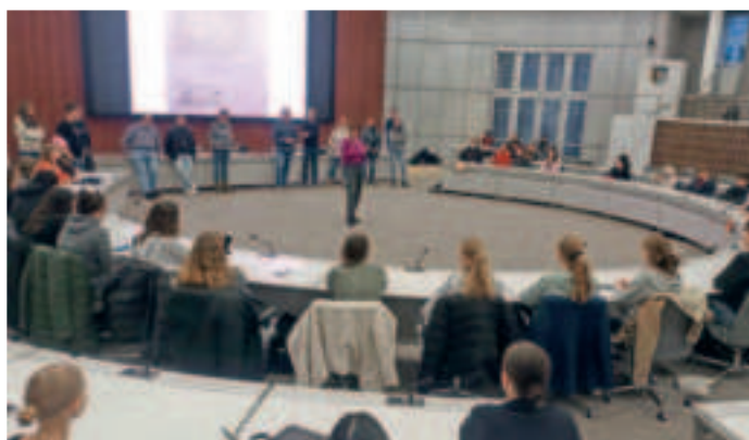
Im renovierten Sitzungssaal des Forums fand die KoPra-Ratssitzung als Rollenspiel der 14- bis 17-jährigen statt.

Das Kommunalpolitische Praktikum (KoPra) ist die Gelegenheit für 14- bis 17-Jährige, zu erfahren, wie Politik